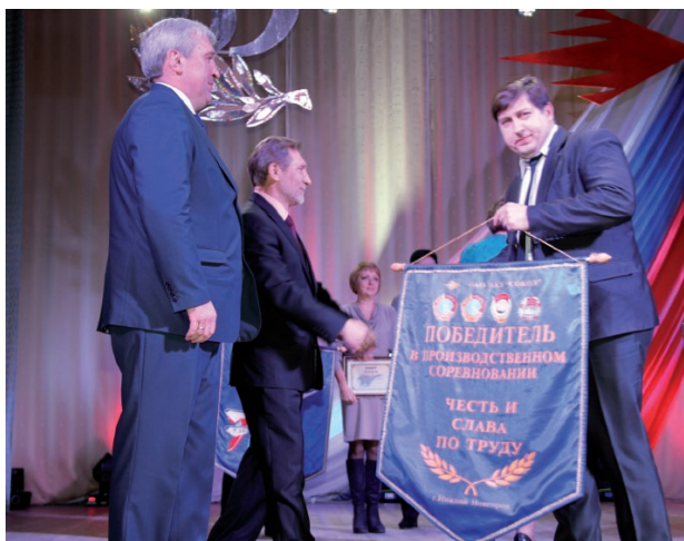
День рождения завода.

Организация культурно-массовой работы на предприятии велась в соответствии с утвержденным совместным планом профсоюзной организации и администрации по проведению культурно-массовых мероприятий НАЗ «Сокол»-филиала АО «РСК «МИГ» в 2017 году (приказ № 16 от 30.01.2017 г.).