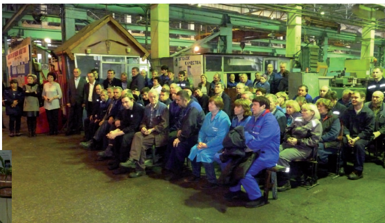
Собрание коллектива цеха 72 по обсуждению КД.

Прделана серьезная работа по запуску статей КД. На данное время все статьи колдоговора распространены и реально работают в НАЗ «Сокол». Процесс запуска ряда положений КД идет сложно и порой болезненно ввиду разницы, существовавшей у нас и действующей в корпорации системы принятия управленческих решений.