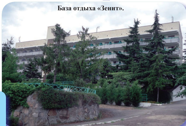
База отдыха «Зенит».

Вопрос с проездом в Крым решался самостоятельно: отдыхающие приобретали билеты на поезд, самолет, а также путешествовали на собственных автомобилях.