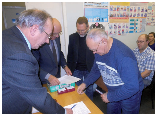
Награждение уполномоченных по ОТ.