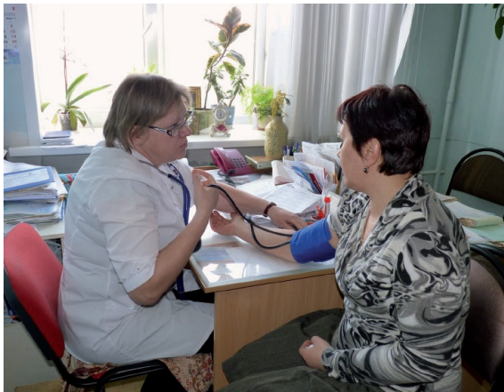
На приеме у терапевта.