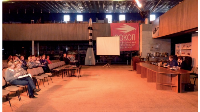
Собрание коллектива отдела главного металлурга по вопросам колдоговора.

Областной комитет профсоюза одобрил практику работы нашей профсоюзной организации по защите социально-экономических прав и интересов членов профсоюза при заключении КД, признал наш колдоговор как нормативный акт, наиболее соответствующий Отраслевому соглашению, и рекомендовал наш опыт к внедрению во всех профсоюзных организациях.